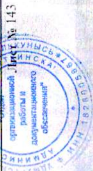
Схема размещения рекламных конструкций

Примечание: в проекте не предусмотрено размещение рекламных конструкций на фасадах зданий.